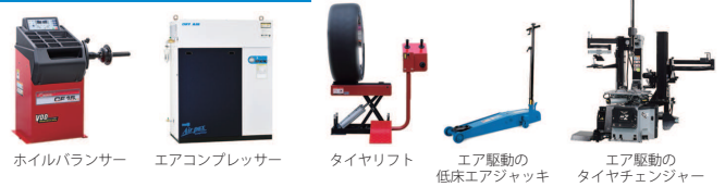
ホイールバランス エアコンプレッサー タイヤリフト エア駆動の低床エアジャッキ エア駆動のタイヤチェーン

住 所：瀬戸内市長船町長船640 TEL：(0869)92-4641 営業時間：8時半～17時半 定休日：日曜・祝日