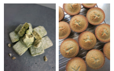
キャラドネージュ フィナンシェ

お客様との出会いを大切に、お客様のお茶の時間が、少し特別な時間になって欲しいと思っています。