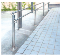
個人住宅ステンレス製手すりの設計・製作・設置を行っています。

当社のある牛窓地域は、海や夕日、島々の風景といった自然美が広がっています。個人的には、生まれ育った牛窓の美しい景観と親和性が高い取組みをしたいと感じていました。当社の作る「レジンアート」は、そんな牛窓の自然美を彷彿とさせるような波の表現など、細部までこだわりを持った製作を行っています。体験教室については現在（R 8.3月末時点）準備中ですが、実施ができるようになった際は、ぜひ多くの方々に製作体験をして欲しいと思っています。