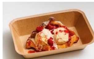
アイスクロワッサン