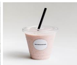
イチゴのスムージー