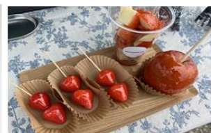
イチゴ飴とリンゴ飴