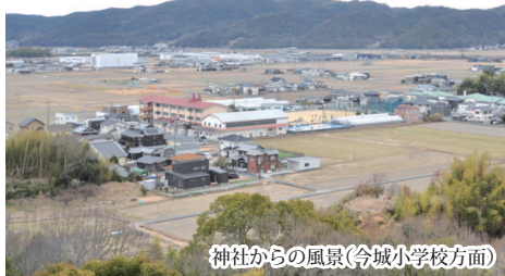
神社からの風景(今城小学校方面)