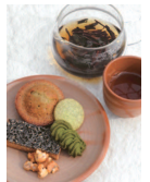
お茶の時間を少し特別に

住 所：瀬戸内市長船町 TEL：070-9023-3994 営業時間：9時～18時 定休日：日曜