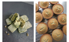
キャラドネージュ フィナンシェ

お客様との出会いを大切に、お客様のお茶の時間が、少し特別な時間になって欲しいと思っています。