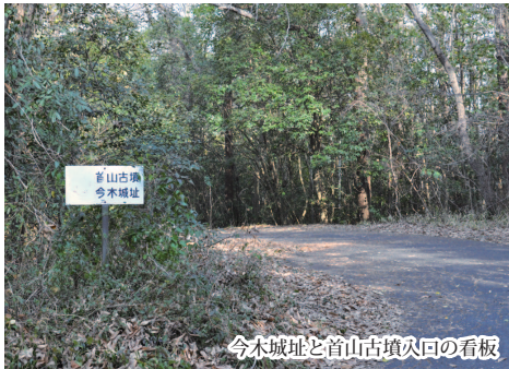
今木城址と首山古墳火口の看板

向山の首山には十一基の古墳があると今城村史には書かれていますが、現在、確認が出来るのは1基だけとの事です。頂上に石棺の蓋だと思われる平たい石が残っています。