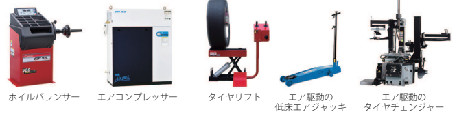
ホイールバランス エアコンプレッサー タイヤリフト エア駆動の低床エアジャッキ エア駆動のタイヤチェーン

住 所：瀬戸内市長船町長船640 TEL：(0869)92-4641 営業時間：8時半～17時半 定休日：日曜・祝日