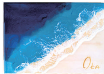
岡社長が実際に作成したレジンアート

住 所：瀬戸内市牛窓町牛窓40-1 TEL：(0869)34-2431 営業時間：8時～17時 定休日：土曜・日曜