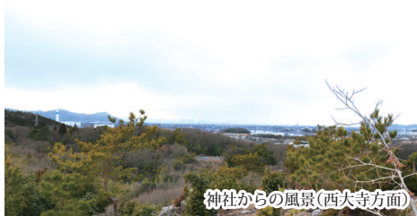
神社からの風景(西大寺方面)