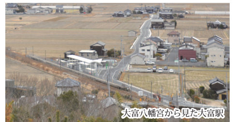
大富八幡宮から見た大富駅

しかし、多くの住民が鉄道の開通を望んでいたため、昭和11年(1936)に山陽鉄道の迂回路として赤穂線建設事業が持ち上がり、昭和13年(1938)相生~赤穂間の工事が着工されました。途中、戦争の為、工事が中断しましたが、昭和37年(1962)9月1日に相生駅から赤穂市を経て東岡山駅へ接続する全長57キロが完成し、大富駅が開設されました。その後、昭和44年(1969)10月に電化されました。